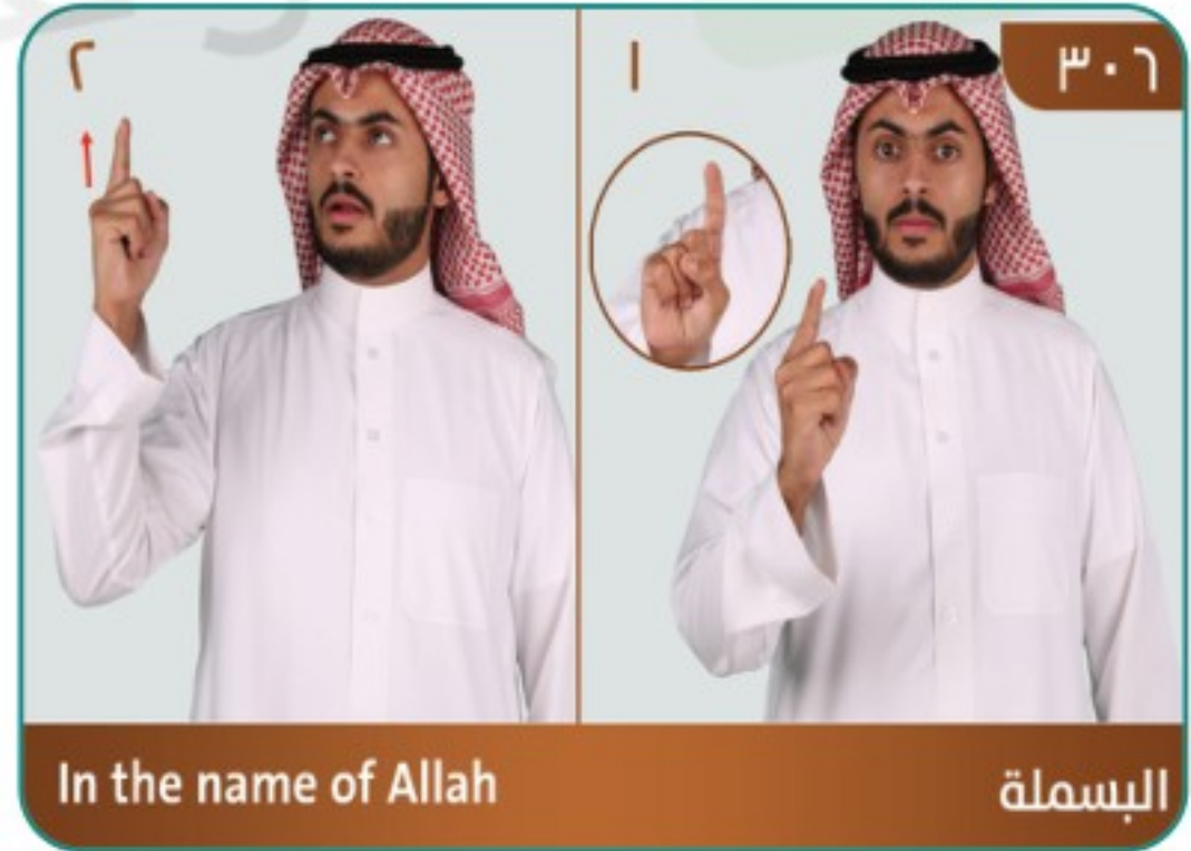
In the name of Allah