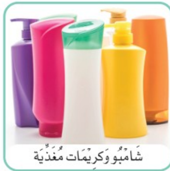
شَامْبُو وَكْرِيمَاتُ مُغْذِيَّة