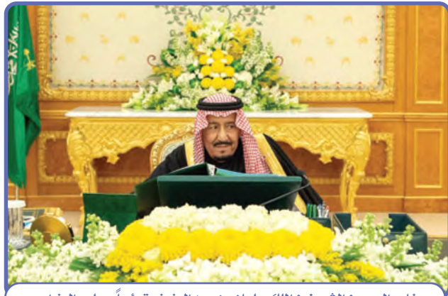
خادم الحرمين الشريفين الملك سلمان بن عبدالعزيز مترئساً لمجلس الوزراء

قال خادم الحرمين الشريفين الملك سلمان بن عبدالعزيز في كلمته للشعب السعودي عندما تولى الحكم: «سنظل بحول الله وقوته متمسكين بالنهج القويم الذي سارت عليه هذه الدولة منذ تأسيسها على يد الملك المؤسس عبدالعزيز وأبنائه من بعده».