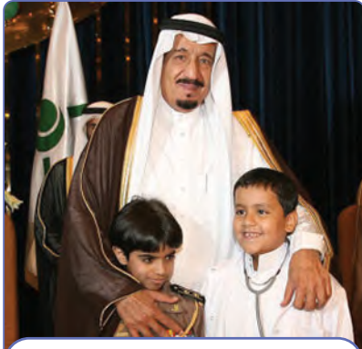
عنايته بأبناء الوطن الصغار

يحرص خادم الحرمين الشريفين الملك سلمان بن عبدالعزيز على الثقافة والقراءة، وخصوصاً في مجال التاريخ، كما أن مجالسه دائماً مشغولة بالنقاش العلمي، ويداوم على القراءة يومياً، ولديه مكتبة غنية بالكتب.