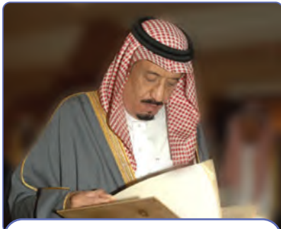
عنايته بالتاريخ والتراث