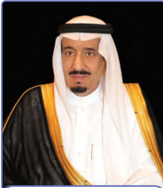
خادم الحرمين الشريفين الملك سلمان بن عبدالعزيز

خادمُ الحرمين الشريفين وملكُ المملكة العربية السعودية الملك سلمان بن عبدالعزيز بن عبدالرحمن بن فيصل بن تركي آل سعود.