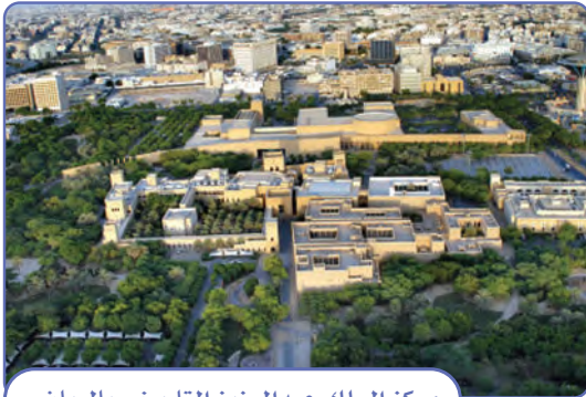
مركز الملك عبدالعزيز التاريخي بالرياض

يعتني خادم الحرمين الشريفين الملك سلمان بن عبدالعزيز آل سعود بالتاريخ الوطني؛ لأنه ذاكرة الوطن، ومنه يستلهم المواطن الفخر والاعتزاز، ومن الأمثلة على ذلك أنه يشجع الدراسات التاريخية الوطنية ويعتني بمؤسساتها، ويحرص على العناية بالتراث الوطني.