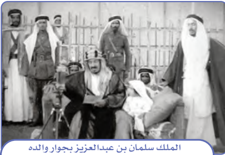
الملك سلمان بن عبدالعزيز بجوار والده الملك عبدالعزيز وعمره ستان ونصف

يقرأ الطلبة النص الآتي ثم يجيبون عن السؤال: