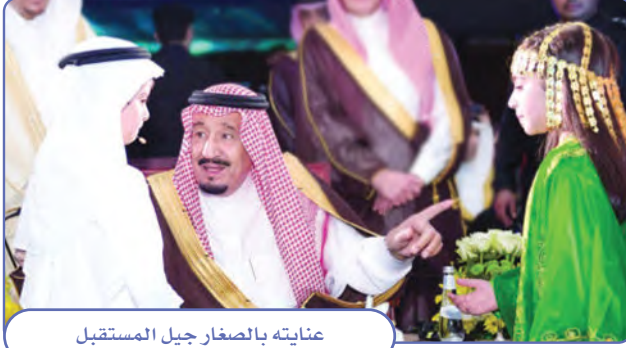
عنايته بالصغار جيل المستقبل

يدعم خادم الحرمين الشريفين الملك سلمان بن عبدالعزيز أعمال الخير، فقد ساعد على جمع التبرعات لمنكوبي السويس عام ١٣٧٥هـ، وساعد أُسر شهداء الأردن في عام ١٣٨٧هـ، وساعد الفلسطينيين وأُسْرهم، وساند منكوبي الزلازل في دول العالم ومن ضمنها باكستان، ومنتزري السيول في السودان، والمسلمين في البوسنة والهرسك والصومال وبنجلاديش وغيرها، بالدعم والإغاثة.