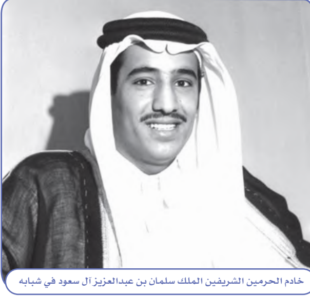
خادم الحرمين الشريفين الملك سلمان بن عبدالعزيز آل سعود في شبابه

حظي خادم الحرمين الشريفين الملك سلمان بن عبدالعزيز آل سعود بالعناية الخاصة من والده الملك عبدالعزيز، الذي أتاح له الاطلاع على ما تقوم به الحكومة من أعمال وهو في سن صغيرة. واعتنت به والدته الأميرة حصة بنت أحمد السديري المعروفة بشخصيتها ومكانتها واهتمامها بتربية أبنائها تربية صالحة .