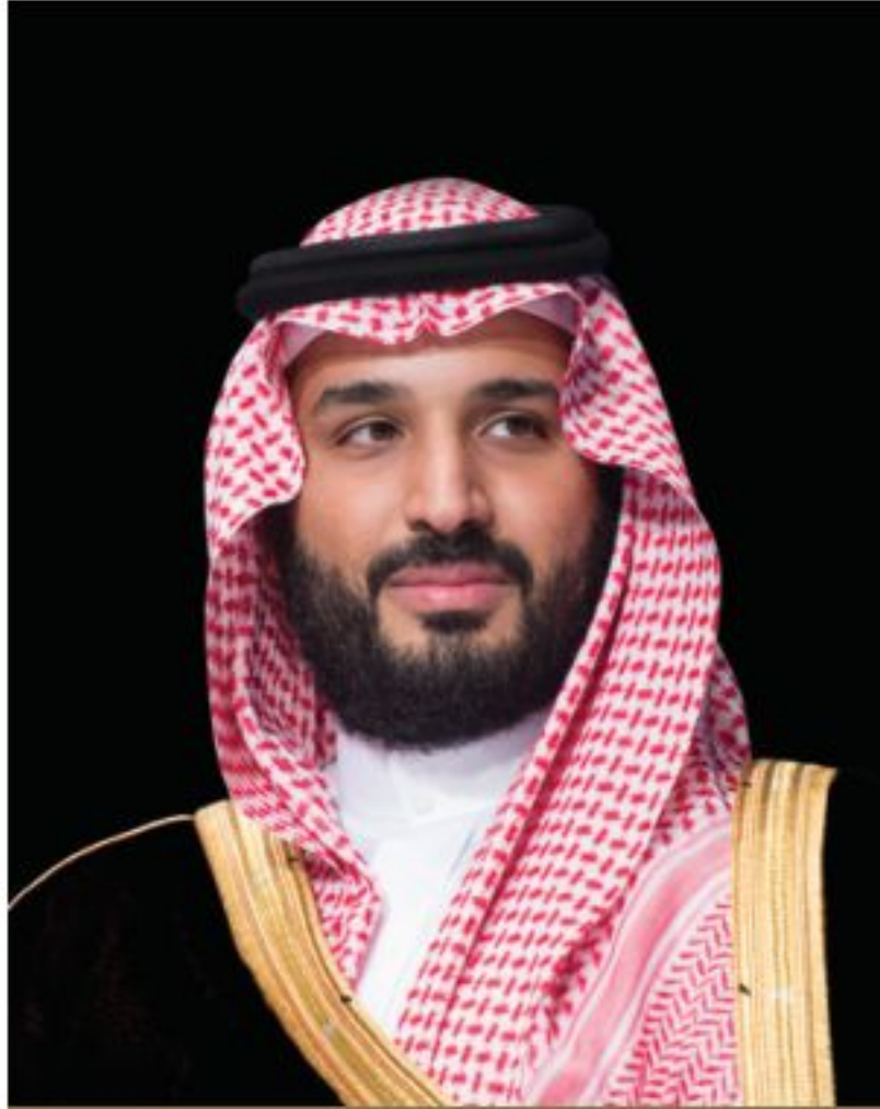
صاحب السمو الملكي الأمير محمد بن سلمان بن عبدالعزيز آل سعود ولي العهد رئيس مجلس الوزراء