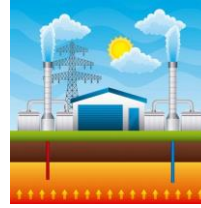
الطاقة الحرارية الجوفية