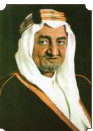
الملك فيصل بن عبدالعزيز آل سعود

"نعتزّ بذكرى تأسيس هذه الدولة المباركة في العام ١١٣٩هـ (١٧٢٧م)، ومنذ ذلك التاريخ وحتى اليوم؛ أرسيت ركائز السلم والاستقرار وتحقيق العدل. وإن احتفاءنا بهذه الذكرى؛ هو احتفاءً بتاريخ دولة، وتلاحم شعب، والصمود أمام كل التحديات، والتطلع للمستقبل. والحمد لله على كل النعم".