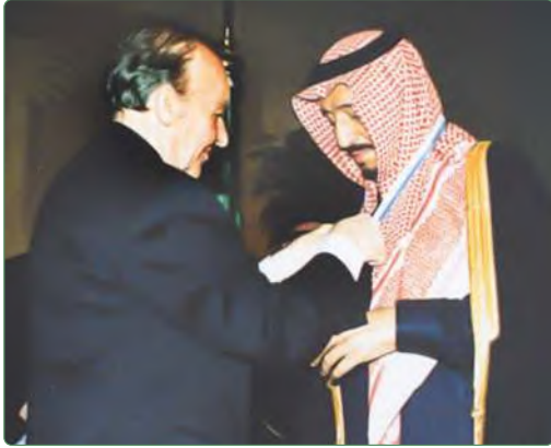
الوسام الذهبي لجمهورية البوسنة والهرسك

أصبحت الرياض اليوم - مدينةً ومنطقةً - نموذجاً ناجحاً للتطوير والإنجاز برعاية ومتابعة خاصة من لدن الملك سلمان بن عبدالعزيز؛ فلقد نظر إلى الرياض بعيون المستقبل فبهر الجميع بما آلت إليه الأمور اليوم. وسار في التطوير على نهج مدروس ومنظم، وبنى مؤسسات لتحقيق ذلك حتى أصبحت نماذج ناجحة ومميزة في الإدارة والتنفيذ. فمنهجية تطوير مدينة الرياض - والآن هيئة تطوير بوابة الدرعية - تقفان بكل شموخ معالم شاهدة على شخصية الملك سلمان الثاقبة والواعية بأهمية البناء والتطوير. فعند رئاسته لهيئة تطوير مدينة الرياض مدةً تصل إلى نحو الأربعين عاماً نُفذت برامج إنشائية وُبنى تحتية كبيرة جداً، ومشروعات عملاقة في الرياض، حتى أصبحت الهيئة نموذجاً يحتذى به في التخطيط والدراسة والتنفيذ.