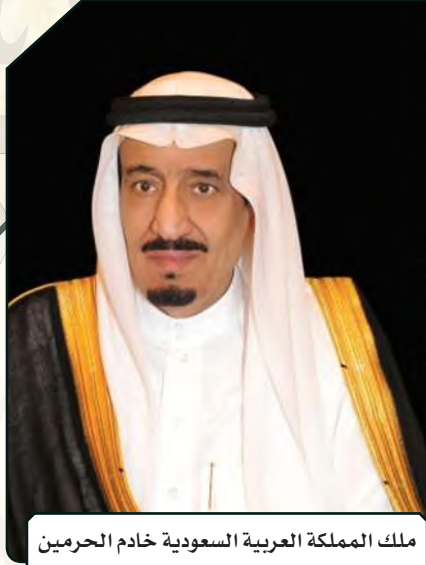
ملك المملكة العربية السعودية خادم الحرمين الشريفين الملك سلمان بن عبدالعزيز آل سعود