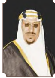
الملك سعود بن عبدالعزيز آل سعود

"إن بلادنا والله الحمد شهدت منذ تأسيسها على يد الموحّد الملك عبدالعزيز -برحمه الله - نهضة حضارية شاملة، استهدفت الإنسان السعودي في عيشه وعمله وأمنه وصحته وتعليمه".