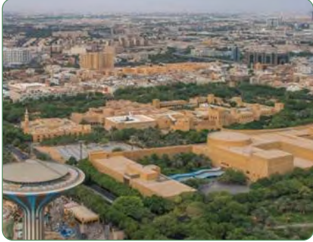
مركز الملك عبدالعزيز التاريخي بمدينة الرياض