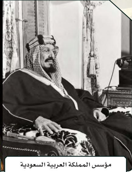
مؤسس المملكة العربية السعودية الملك عبدالعزيز بن عبدالرحمن آل سعود

قامت المملكة العربية السعودية منذ تأسيس الدولة السعودية الأولى إلى اليوم على جهود شخصيات تاريخية أسهمت إسهاماً فاعلاً في إعادة تأسيس الدولة السعودية وبنائها، ومن تلك الشخصيات: الإمام محمد بن سعود، والإمام تركي بن عبدالله بن محمد بن سعود، والملك عبدالعزيز بن عبدالرحمن آل سعود، وخادم الحرمين الشريفين الملك سلمان ابن عبدالعزيز آل سعود. وتمثل هذه الشخصيات أنموذجاً مميزاً للمواطن السعودي الذي يعتني بوطنه ومبادئه وقيمه. كما تأسس عدد من المؤسسات الوطنية التي تُعنى بالمصادر التاريخية الوطنية، والقيام على خدماتها وإتاحتها ونشرها، مثل: دار الملك عبدالعزيز، والمركز الوطني للوثائق والمحفوظات، ومكتبة الملك فهد الوطنية.