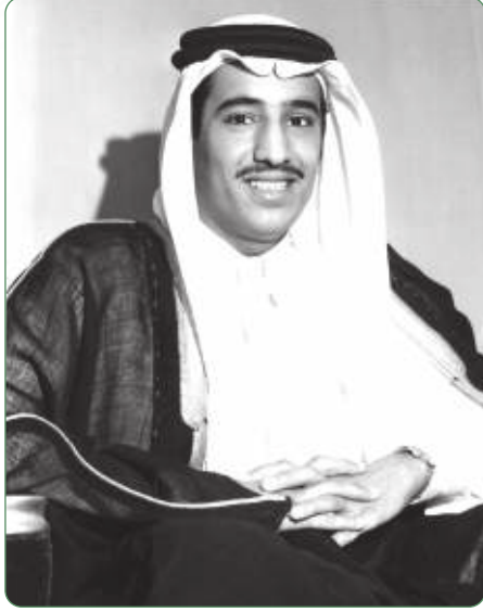
خادم الحرمين الشريفين الملك سلمان بن عبدالعزيز آل سعود في شبابه