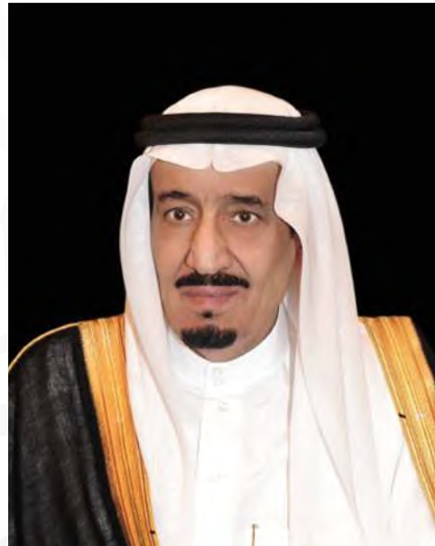
خادم الحرمين الشريفين الملك سلمان بن عبدالعزيز آل سعود ملك المملكة العربية السعودية