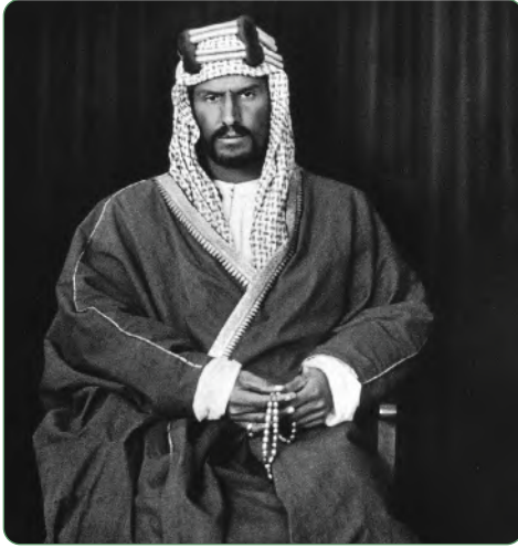
الملك عبدالعزيز عام ١٣١٨هـ

الملك عبدالعزيز بن عبدالرحمن بن فيصل ابن تركي آل سعود، ولد في الرياض عام ١٢٩٣هـ. مؤسس المملكة العربية السعودية عام ١٣١٩هـ.