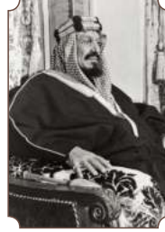
الملك عبدالعزيز بن عبدالرحمن آل سعود

"قامت الدولة السعودية الأولى منذ أكثر من قرنين ونصف على الإسلام، وعلى مناهج واضح في السياسة والحكم والدعوة والاجتماع".