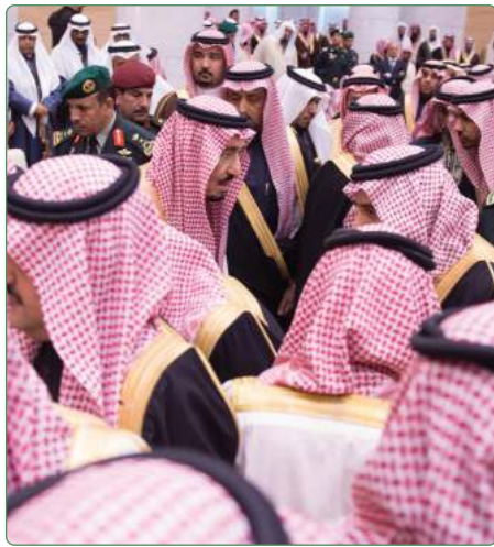
مبايعة الملك سلمان بن عبدالعزيز عام ١٤٣٦هـ

عبدالعزيز التي أصبح رئيساً لمجلس إدارتها منذ عام ١٤١٧هـ، وشهدت نتيجةً لذلك تطوراً كبيراً حتى أصبحت اليوم من المؤسسات الوطنية الرائدة في تحقيق أهدافها.