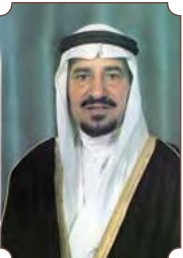
الملك خالد بن عبدالعزيز آل سعود

"لدينا عمق تاريخي مهم جداً موغل بالقدم ويتلاقى مع الكثير من الحضارات. الكثير يربط تاريخ جزيرة العرب بتاريخ قصير جداً، والعكس أننا أمة موغلة في القدم".