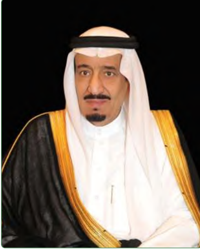
خادم الحرمين الشريفين الملك سلمان بن عبدالعزيز آل سعود ملك المملكة العربية السعودية

ولد خادم الحرمين الشريفين الملك سلمان بن عبدالعزيز في مدينة الرياض عام ١٣٥٤هـ، وتلقى تعليمه على أيدي عدد من العلماء والمشايخ، واستفاد من عناية والده المؤسس الملك عبدالعزيز -رحمه الله- بأبنائه ومتابعتهم شخصياً في الدراسة. التحق بمدرسة الأمراء في الرياض مع إخوانه وتلقى تعليمه الأساسي فيها. واحتفلت مدرسة الأمراء بختمه قراءة القرآن الكريم في عام ١٣٦٤هـ وعُمره نحو عشر سنوات.