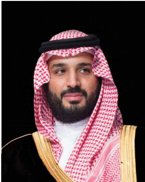
صاحب السمو الملكي الأمير محمد بن سلمان بن عبدالعزيز آل سعود ولي العهد، نائب رئيس مجلس الوزراء، وزير الدفاع