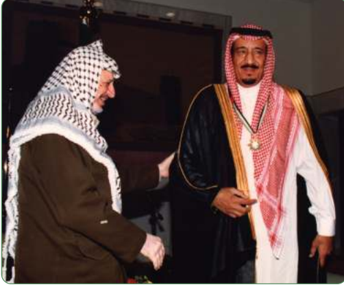
الرئيس الفلسطيني ياسر عرفات يقبل الملك سلمان بن عبدالعزيز وسام فلسطين