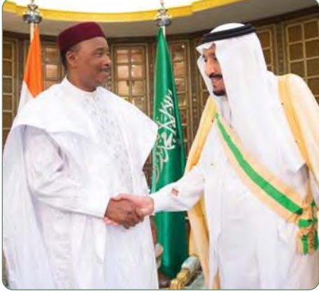
الملك سلمان بن عبدالعزيز يتسلم وسام النيجر