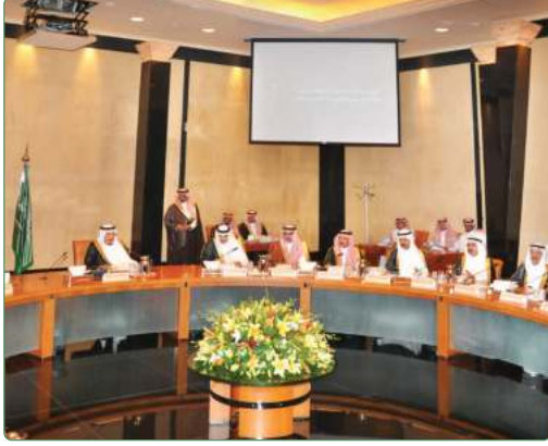
الملك سلمان يرأس اجتماع هيئة تطوير مدينة الرياض